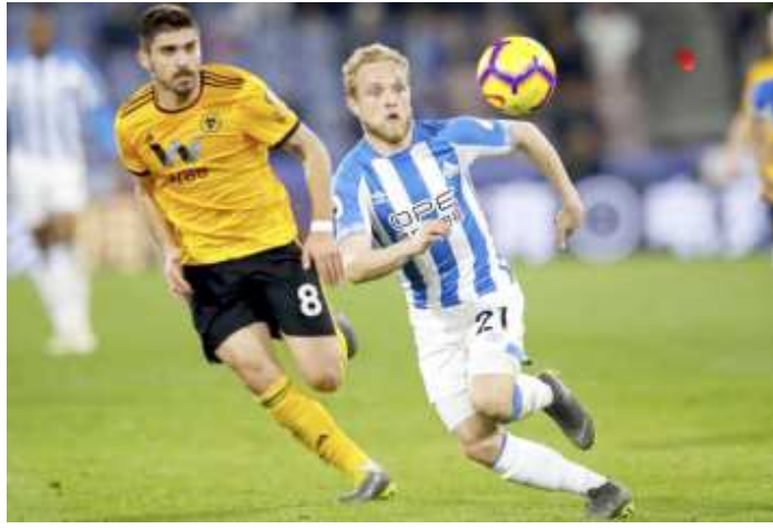
हुडरसफील्ड में प्रीमियर लीग फुटबॉल मैच में खेलते हुए खिलाड़ी।

सूचना के दुरुपयोग' जैसे कोई सबूत नहीं है। श्रीलंकाई क्रिकेट में बड़े स्तर पर फेले भ्रष्टाचार की आईसीसी की जांच के दौरान जयसूर्या से पूछताछ की गयी थी। जयसूर्या ने कहा, "यह दुर्भाग्यपूर्ण है कि भले ही मैंने अधिकारियों द्वारा मांगी गयी सारी जानकारी आईसीसी एसीयू को उपलब्ध करायी थी लेकिन आईसीसी एसीयू ने मुझ पर आचारसंहिता के तहत आरोप लगा दिया हालांकि भ्रष्टाचार, सट्टेबाजी या आंतरिक सूचना के दुरुपयोग का कोई आरोप नहीं था।" जयसूर्या ने कहा कि उन्होंने हमेशा उच्च मानदंडों के साथ यह क्रिकेट खेला है। उन्होंने कहा, "मैंने हमेशा देश को सबसे पहले रखा और क्रिकेट प्रेमी जनता इसका गवाह रही है।"