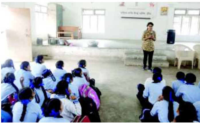
आयोजन किया गया। इस दौरान बेटी बचाओ, बेटी पढ़ाओ अभियान अंतर्गत महिला

प्राप्त जानकारी के अनुसार महिला शक्ति केन्द्र दीव द्वारा घोघला स्थित सरकारी उच्चतर माध्यमिक कन्या विद्यालय में विभाग द्वारा संचालित गतिविधियों से अवगत करने तथा छात्राओं को जानकारी देने के लिए जागरूकता कार्यक्रम का